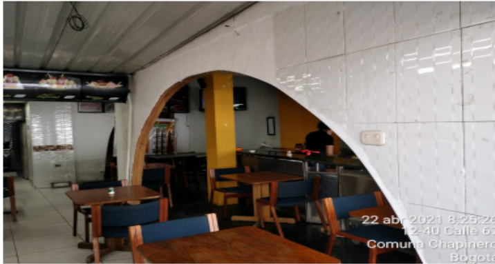
Fotografía No. 4. Vista al interior del establecimiento actual.